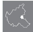
Lage des Stadtteils in Hamburg

Die hier erwähnten Straßen stellen nur einen Ausschnitt aus dem gesamten Wohnungsangebot der Geschäftsstelle dar. Die Karten dienen lediglich der Übersicht, eine Vollständigkeit ist nicht gewährleistet.