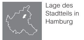
Lage des Stadtteils in Hamburg

Die hier erwähnten Straßen stellen nur einen Ausschnitt aus dem gesamten Wohnungsangebot der Geschäftsstelle dar. Die Karten dienen lediglich der Übersicht, eine Vollständigkeit ist nicht gewährleistet.