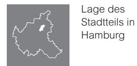
Lage des Stadtteils in Hamburg

Die hier erwähnten Straßen stellen nur einen Ausschnitt aus dem gesamten Wohnungsangebot der Geschäftsstelle dar. Die Karten dienen lediglich der Übersicht, eine Vollständigkeit ist nicht gewährleistet.