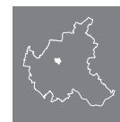
Lage des Stadtteils in Hamburg