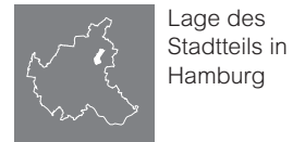
Lage des Stadtteils in Hamburg

Die hier erwähnten Straßen stellen nur einen Ausschnitt aus dem gesamten Wohnungsangebot der Geschäftsstelle dar. Die Karten dienen lediglich der Übersicht, eine Vollständigkeit ist nicht gewährleistet.