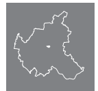
Lage des Stadtteils in Hamburg

Die hier erwähnten Straßen stellen nur einen Ausschnitt aus dem gesamten Wohnungsangebot der Geschäftsstelle dar. Die Karten dienen lediglich der Übersicht, eine Vollständigkeit ist nicht gewährleistet.