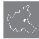
Lage des Stadtteils in Hamburg

Die hier erwähnten Straßen stellen nur einen Ausschnitt aus dem gesamten Wohnungsangebot der Geschäftsstelle dar. Die Karten dienen lediglich der Übersicht, eine Vollständigkeit ist nicht gewährleistet.