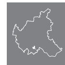
Lage des Stadtteils in Hamburg