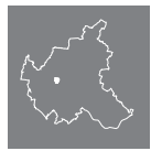
Lage des Stadtteils in Hamburg