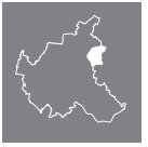
Lage des Stadtteils in Hamburg