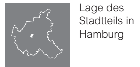
Lage des Stadtteils in Hamburg