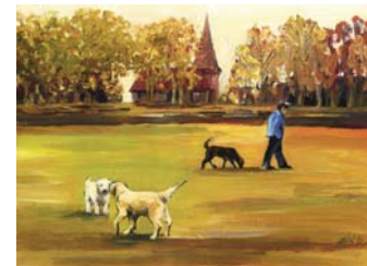
Kirchgang (13. OG)