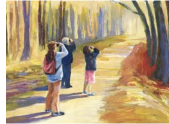
Ja, wo fliegen sie denn? (11. OG)