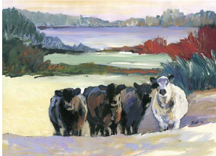
Auf den wilden Weiden (5. OG)