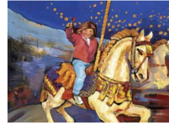
Nochmal drei Runden! (10. OG)