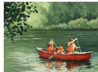
Sonntag am See (7. OG)