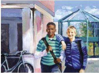
Schulschlusslächeln (1. OG)