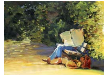
Früher Feierabend (9. OG)