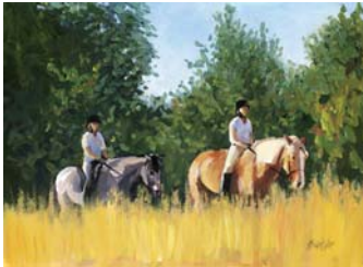
Sommerferienglück (3. OG)