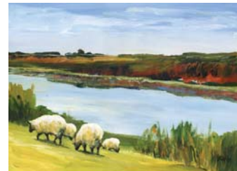
Höltigbaumwiesen (14. OG)