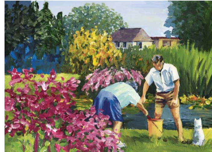
Wochenend und Sonnenschein (12. OG)