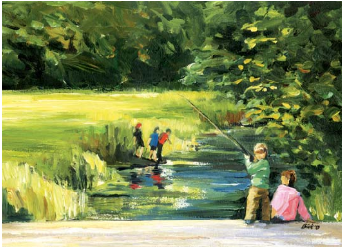
Stromern am Strom (4. OG)