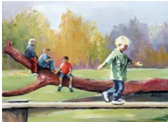
Balance (2. OG)