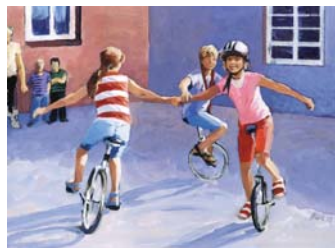
Wir haben geübt (6. OG)