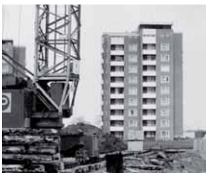
Der Reemstückenkamp 1966 ...

schichte hautnah miterlebt. Seit sie vor 45 Jahren dorthin zog, hat sich viel verändert. Ursprünglich waren in der Quartiersmitte nur 60 Wohnungen vorgesehen, doch die Flutkatastrophe von 1962 änderte alles. Über Nacht wurden Tausende Hamburger obdachlos. Um zusätzlichen Wohnraum zu schaffen, wurden die Pläne kurzfristig geändert. Architektonisch interessante Terrassenhäuser mit 140 attraktiven