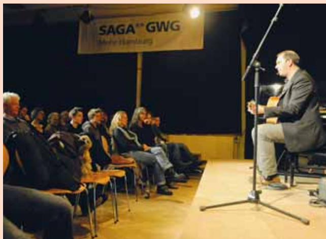
Bereits in der Vorrunde waren die Veranstaltungen gut besucht