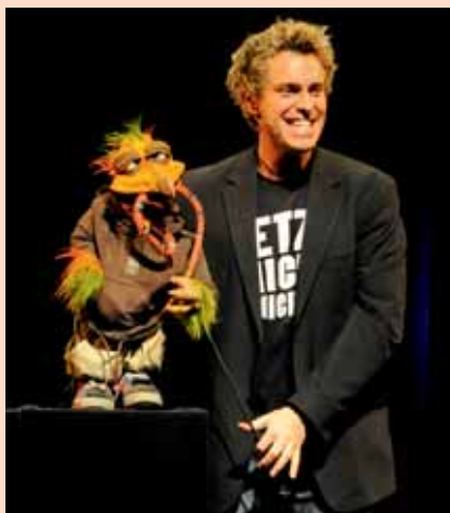
Sascha Grammel im Dialog mit seinem Raben Frederic Freiherr von Furchensumpf