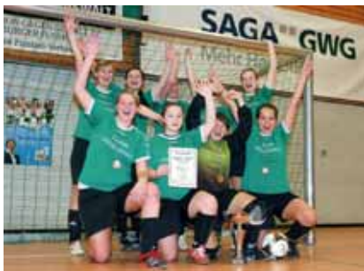
Gewinnermannschaft im Damenfußballturnier: die Damen des Tura Meldorf