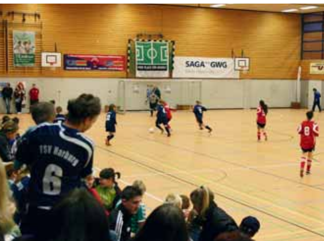
Packende Duelle sorgten in den Sporthallen Dratelnstraße für Stimmung bei den Zuschauern