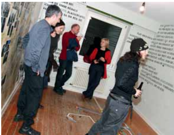
Die eindringlichen Texte und interessanten Fotoarrangements zogen die Besucher in den Bann