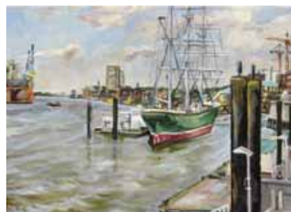
Die „Rickmer Rickmers“ in Öl von Ole Fink