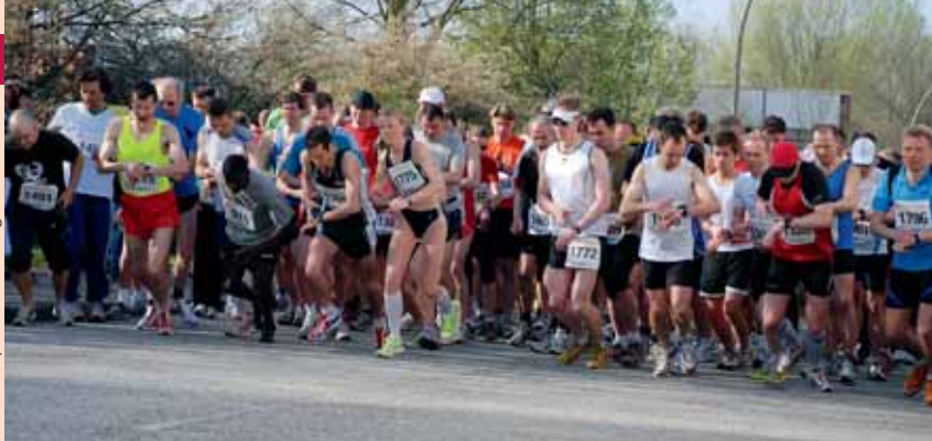
Zahlreiche Läufer kämpfen in Wilhelmsburg um jede Sekunde