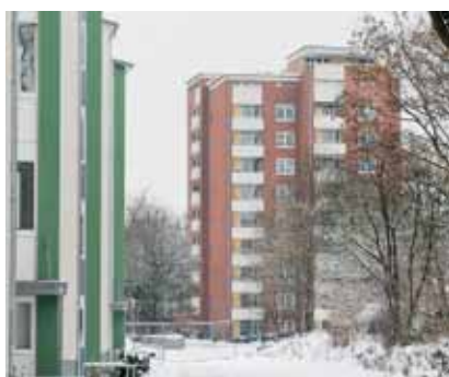
... und heute

Wohnungen entstanden. Die Hamburger Wirklichkeit drückte dem Quartier damit nachhaltig ihren Stempel auf. Jahre später wiederholte sich die Geschichte, wenn auch unter anderen Vorzeichen. „Nach der Wende kamen viele Menschen aus den neuen Bundesländern und suchten Wohnungen“, erinnert sich Scholz, „da wurden die Zeilenbauten gegenüber noch einmal aufgestockt.“