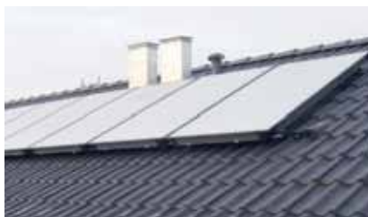
Bereit zum Sonne tanken: Solarthermie-Kollektoren in Billstedt

rund ein Drittel. Allein durch die Solaranlage auf dem Dach werden etwa 6.000 Kubikmeter Erdgas pro Jahr eingespart. Ergänzt durch die neuen Heizzentralen und die wärmege-dämmten Fassaden und Fenster ergibt sich sogar ein noch höherer Wert: je nach Witterung und Verbrauchsverhalten produzieren die Mieter in Billstedt künftig pro Jahr rund 377 Tonnen CO 2 weniger als vor der Modernisierung. (CJP)