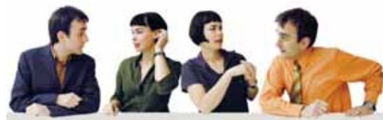
Das Duo bei einer Kommunikations-Performance in Nürnberg

Informationen über das Künstler-Duo und seine Arbeiten sind unter www.workworkwork.de zu entdecken. (KM)