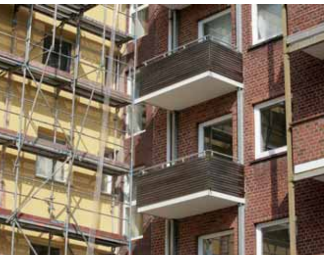
Die neue (li.) und die alte Fassade im Innenhof

Gebäudeverbesserungen gibt es nicht zum Nulltarif. Energiesparende Modernisierungen haben Auswirkungen auf die Miete. Aber dafür bleiben die Heizkosten niedrig! „Die Kalt-