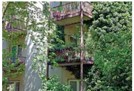
Bali oder St. Pauli? Großstadtdschungel im Hinterhof