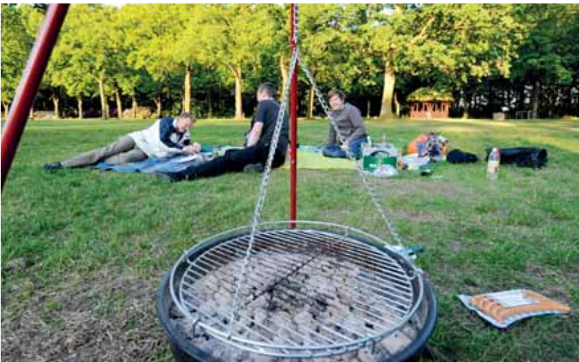
Hamburg bietet eine Vielzahl an Parks und Grünflächen, die zum Grillen einladen, wie hier im Volkspark

Bitte sauber bleiben! Essensreste, leere Flaschen, Einweg-Grills und Kohlereste verschandeln die schönsten Ecken der Stadt immer mehr. Allein nach dem Osterwochenende mussten Mitarbeiter der Hafenbehörde mehr als 20 Tonnen Müll, das sind 1.000 volle Säcke, am Elbufer einsammeln. Vor allem durch Einweg-Grills hat der Müll beachtlich zugenommen. Zudem verbrennen die Wegwerf-Grills immer häufiger Wiesen, wenn sie nicht fachgerecht auf Steine gelegt werden. (TS)