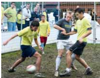
Am letzten Termin der Fußballtreffs gibt es jeweils ein Abschlussturnier – Spannung pur ist angesagt

Sibeliussstraße, 20. Mai bis 26. August, mittwochs 18.00 – 20.00 Uhr Am letzten Termin findet von 16.00 – 20.00 Uhr ein Turnier statt.