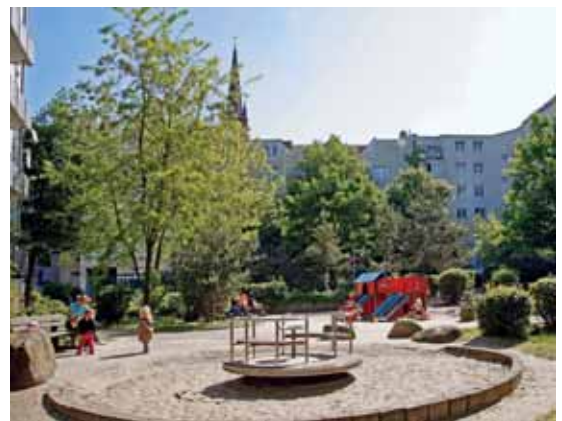
Eine grüne Oase im Herzen von St. Pauli: Die Grünanlage am Pinnsberg

Schicken Sie Ihre Fotos per Post an: WIR gemeinsam, SAGA GWG Mietermagazin, Poppenhusenstraße 2, 22305 Hamburg oder per E-Mail: wirgemeinsam@saga-gwg.de Einsendeschluss ist der 1. September 2009.