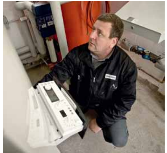
Kontrolle der modernen Heizungsanlage

Unsere Mitarbeiter des haustechnischen Kundendienstes sind Ihre Ansprechpartner, wenn es um die Pflege des Wohngebietes geht. Ihr Hauswart ist für die Sauberkeit und das Funktionieren der haustechnischen Einrichtungen in der Anlage zuständig. Die Telefonnummer und die Sprechzeiten Ihres Hauswartes entnehmen Sie bitte den Aushängen in Ihrem Treppenhaus oder erfragen Sie diese bei Ihrer Geschäftsstelle.