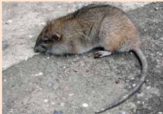
Ratten sind Überträger von vielen Krankheiten und müssen dem Institut für Hygiene und Umwelt gemeldet werden

Sommer, Sonne, Grillvergnügen – für viele Hamburger beginnt in diesen Tagen die schönste Zeit des Jahres. Doch nicht nur wir Menschen fiebern den warmen Temperaturen entgegen. Wie in anderen Metropolen freuen sich auch in Hamburg Ratten über die anstehenden Picknicks und Grillabende. Durch die zusätzlichen Futterquellen können sich die Nager schnell vermehren.