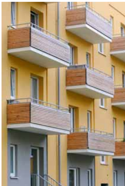
Wetterfestes Holz ist haltbar und bringt Gemütlichkeit

Modernisierungsabteilung und sein Team in Hamburg etwa 500 Balkone im Jahr. Insgesamt investiert SAGA GWG bis zu 200 Mio. Euro pro Jahr in die Modernisierung des Wohnungsbestandes.