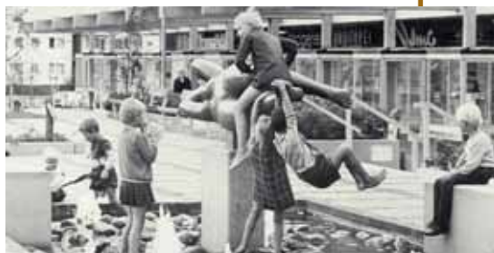
Ob von Wasser oder Pflanzen umgeben – die Skulptur „Oceanide“ ist zeitlos schön