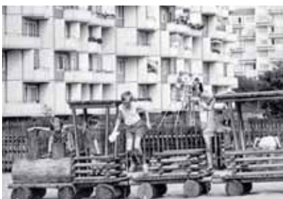
Den Spielplatz vor dem Hochhaus Achtern Born gibt es heute immer noch – eingebettet in üppige Vegetation