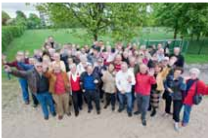
Die ehemaligen Spielfreunde aus dem Hornackredder in Eidelstedt