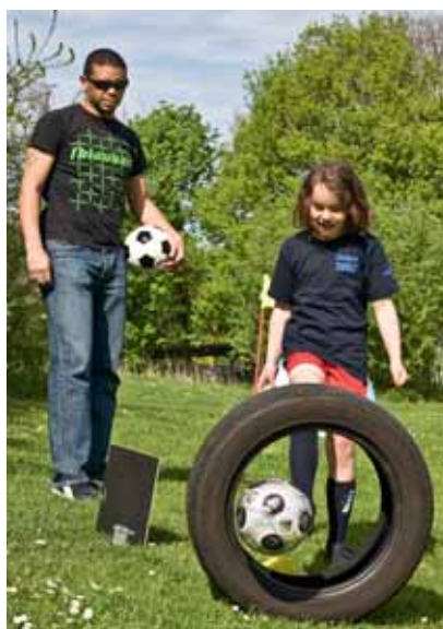
Tilda testet Fußballgolf - gemeinsam mit FC St. Pauli-Legende Michel Mazingu-Dinzey, dem Gaststar der Eröffnung

An zwölf verschiedenen Plätzen in Hamburg kann bei unserem Fußballklassiker Elbkicker gespielt, gedribbelt und geschossen werden. Tore schießen zu langweilig? Oder Kondition momentan etwas unterentwickelt? Wer neugierig ist und vor allem Spaß sucht, sollte unsere neue Sportart Fußballgolf ausprobieren (Bericht in WIR 2/2010). Da sich immer mal etwas ändern kann, unbedingt auf die Ausgänge vor Ort achten. Das komplette Programm steht auch im Internet unter www.saga-gwg.de in der Rubrik Über uns/Sportförderung.