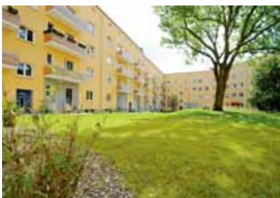
Die Sonne genießen. Balkone schaffen Gartenstimmung