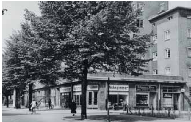
Wo heute Fahrräder und feines Gebäck über den Tresen gehen...