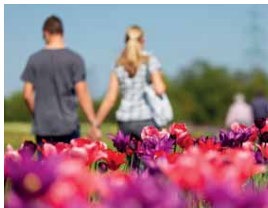
Ein buntes Ausflugsziel in Schleswig-Holstein