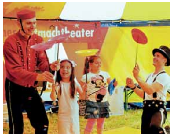
...der Mitmachzirkus für Jüngere...