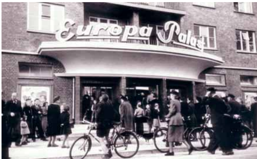
Großes Kino in der Jarrestadt: Der Europa Palast in der Jarrestraße 47

Vor genau 81 Jahren wurde ein Beispiel vorbildlicher Stadtplanung fertig gestellt – die „Jarrestadt“. Das rote Backsteinquartier im Süden Winterhudes galt lange Zeit als wegweisend für die Architektur in Europa und wird auch heute noch für seine ganz „spezielle Art“ von seinen Bewohnern geliebt.