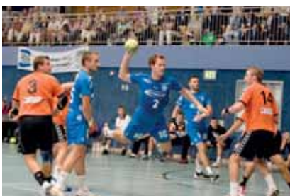
Spannung pur: Das Finale 2010 zwischen Gummersbach und MKS Zagłębie Lubin

Mit dem Schindler-Cup findet vom 19. bis zum 21. August in der Sporthalle des Margaretha-Rothe-Gymnasiums,