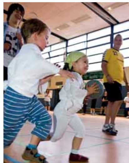
... bis zum Handball-Nachwuchs.