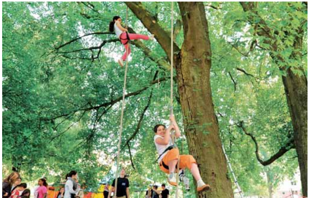
...und Kletteraktionen für Mutige gehören zu dem vielseitigen move!-Angebot