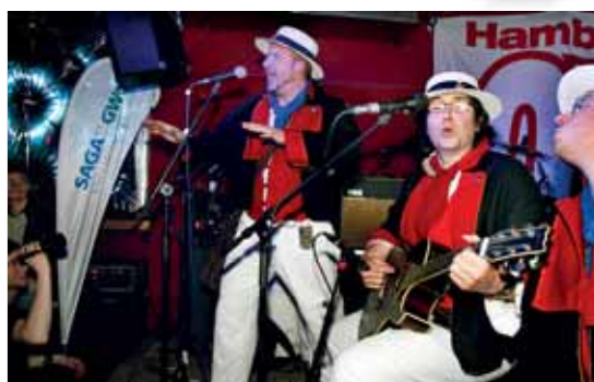
Mit Shanty in die Herzen der Zuhörer: Die Pressgëng