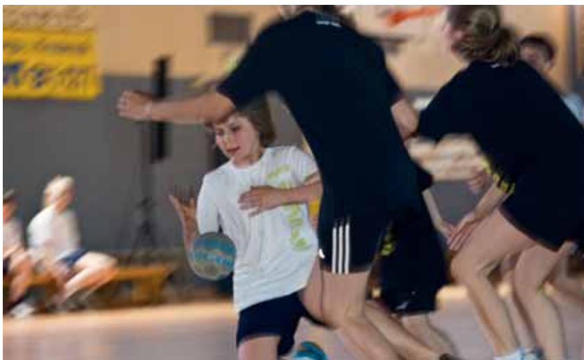
Volles Engagement beim Handball-Marathon: von den Großen...

1697 zu 1540 – so lautete das spektakuläre Ergebnis beim zweiten Wilhelmsburger Handball-Marathon "Wilhma 2011". Freuen konnten sich aber alle Mitspieler, denn mit 49 Stunden haben die Sportler aus Hamburgs Süden einen neuen – wenn auch inoffiziellen - Weltrekord im Dauerhandball aufgestellt. Bereits vor vier Jahren hatte der Verein ein 48-Stunden-Spiel organisiert: Diesmal trafen in der Sporthalle Dratelnstraße 170 Spieler in insgesamt 99 Einzelpartien aufeinander und spielten von Freitagmittag bis Sonntag um 13:30 Uhr, von den Minis bis zum 70-Jährigen Senior-Spieler.