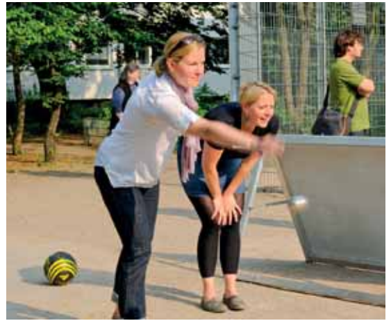
Boule-Training für die Großen...

Nebenan jonglieren Kinder mit Bällen, fahren Einrad oder drehen Teller auf langen Stäben. Hier hat „Alfons Artistischer Mitmachzirkus“ seine