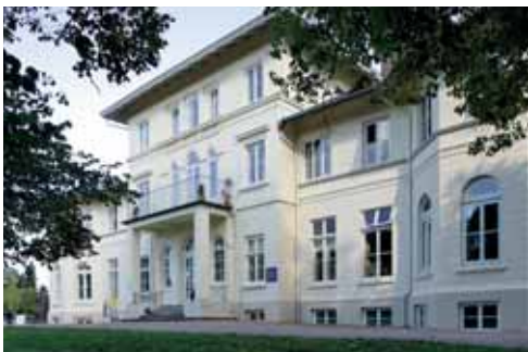
Direkt in Berne und mitten in der Natur: Das Gutshaus Berne

Einst waren Farmsen und Berne zwei eigenständige holsteinische Walddörfer, die im Laufe der Zeit zu einem Stadtteil zusammengewachsen sind und von Hamburg eingemeindet wurden. Natürlich haben ehemalige Walddörfer jede Menge Grün zu bieten und noch heute erinnern zahlreiche Stellen an die dörfliche Vergangenheit: die Gutshäuser und Bauernvillen am Berner Heerweg oder das Herrenhaus von Gut Berne mit seinem einla-