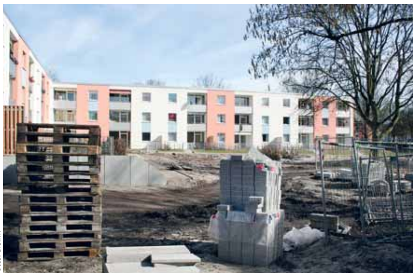
Die Arbeiten haben im Herbst 2010 begonnen