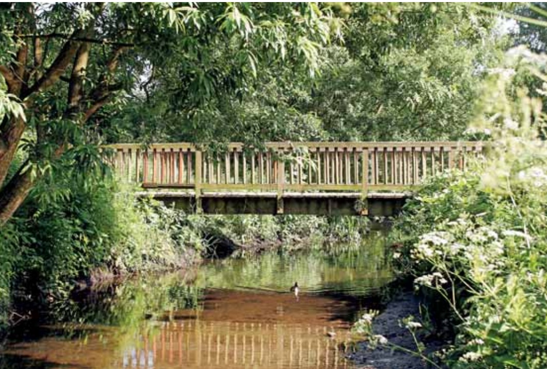
Idylle pur an der Berner Au

Einst waren Farmsen und Berne zwei eigenständige holsteinische Walddörfer, die im Laufe der Zeit zu einem Stadtteil zusammengewachsen sind und von Hamburg eingemeindet wurden. Natürlich haben ehemalige Walddörfer jede Menge Grün zu bieten und noch heute erinnern zahlreiche Stellen an die dörfliche Vergangenheit: die Gutshäuser und Bauernvillen am Berner Heerweg oder das Herrenhaus von Gut Berne mit seinem einla-