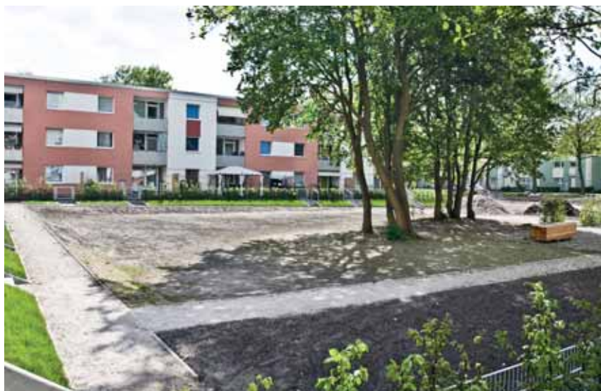
Hier entstehen Freizeit- und Nutzgärten für alle Bewohner