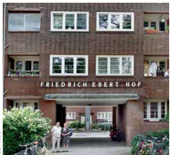
Der Friedrich-Ebert-Hof um 1960 ...