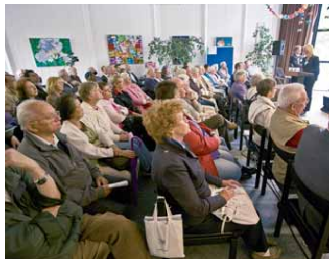
Mehr als 200 Bewohner beteiligten sich am Informationstag im Gemeindezentrum