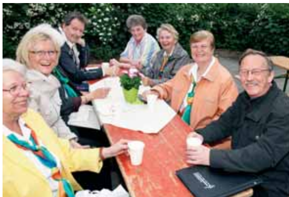
Klönssnack unter Nachbarn – auch die Älteren amüsierten sich