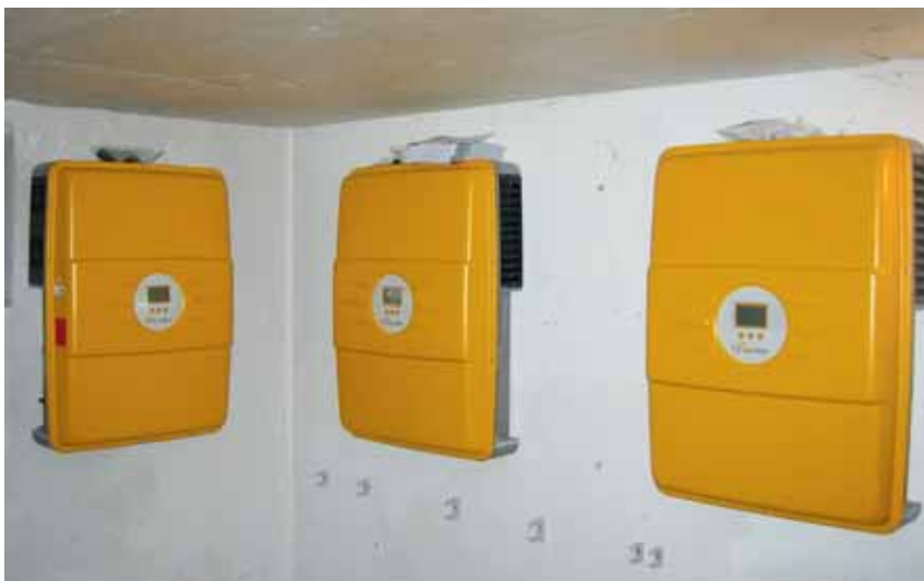
Wechselrichter gehören zu den zentralen Komponenten einer jeden PV-Anlage: sie wandeln den Gleichstrom der Photovoltaik-Anlage in Wechselstrom um

dezentrale Solaranlagen zur Energieerzeugung ein und versuchen damit, nach entsprechender Evaluation, die Nutzung der reichlich vorhandenen