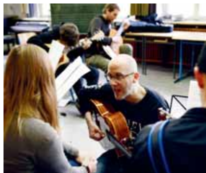
...oder im Workshop: Die Gitarrentage waren ein großer Erfolg