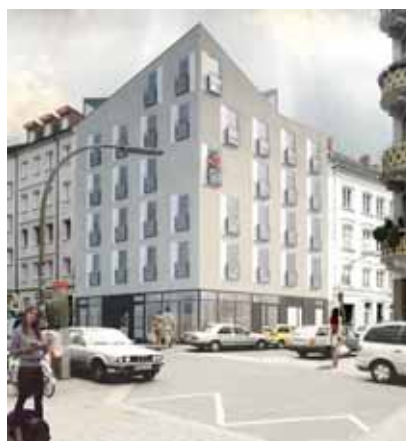
SAGA GWG Neubau in der Marktstraße: Bis Frühjahr 2012 sind alle neuen Wohnungen bezugsfertig

6.000 Wohnungen möchte der Senat künftig jährlich bauen, damit die Hamburgerinnen und Hamburger einen entspannteren Wohnungsmarkt mit angemessenen Mieten auch in innenstadtnahen Lagen finden. Die Weichen für dieses ehrgeizige Vorhaben wurden erfolgreich gestellt: Die Bezirke haben sich vertraglich verpflichtet, ihren Teil beizutragen und im „Bündnis für das Wohnen in Hamburg“ haben SAGA GWG und alle anderen wichtigen Unternehmen der Wohnungswirtschaft vereinbart, an einem Strang zu ziehen, um dieses Ziel umzusetzen.