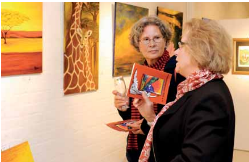
Engagiert kommentierten die Besucher die ausgestellten Arbeiten

Interessierte können sich im Internet unter www.frauenmalgruppe-wir.de oder bei Ingrid Ehmke, Telefon 7 15 58 40, informieren. (CSL)