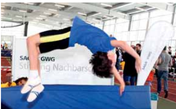
Zusätzliche Akrobatikvorführungen waren ein besonderer Hingucker