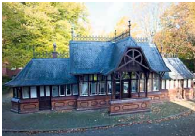
...und heute – umrahmt von Backstein und als Kunstatelier genutzt