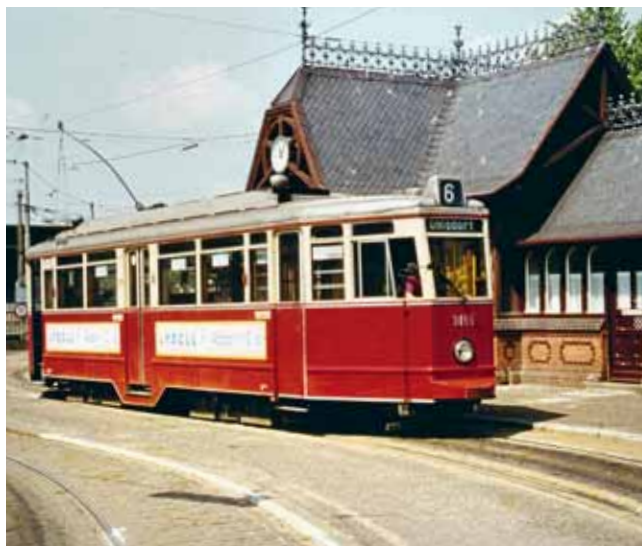
Die historische Haltestelle Im Grünen Grunde im März 1965...