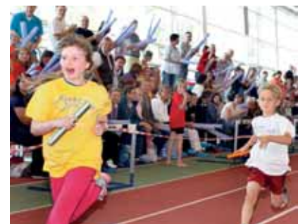
Beim Staffellauf hatte Team Wandsbek die Nase vorn