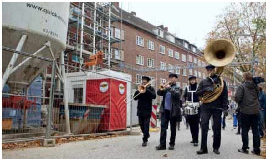
Die Pankokenkapelle sorgte für gute Stimmung im Bäckerbreitengang

gen in der Neustadt und im Karolinnenviertel sind übrigens schon vermietet. Bereits im kommenden Jahr wird es dafür aber eine ganze Reihe weiterer Richtfeste geben. SAGA GWG wird bis Ende 2012 insgesamt etwa 1.500 Wohnungen im Bau haben – ein großer Beitrag, um die Wohnsituation in Hamburg zu entspannen. Das Zustandekommen des „Bündnis für das Wohnen“ ist dabei nicht hoch genug einzuschätzen: Themen wie Baurecht, Flächen, Backstein und Klimaschutz sind für alle Beteiligten in einem Vertrag geregelt, der so das nötige vertrauensvolle Klima in der gesamten Wohnungsbranche schafft, um die notwendigen hohen Wohnungsneubauten zu realisieren. (MA)