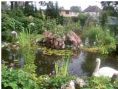
Das Siegerfoto 2009