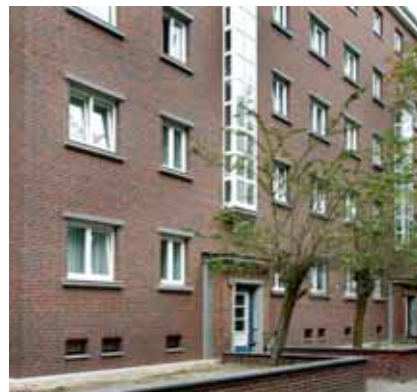
Die Hausfassaden nach der Modernisierung: Die traditionelle Rotklinkeroptik bleibt erhalten