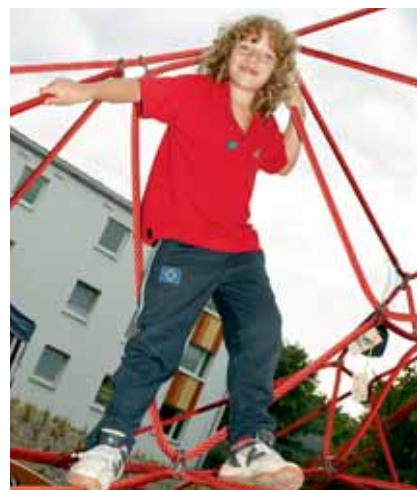
Für kleine und große „Klettermaxe“ gibt es eine vielseitige Auswahl an Spielgeräten

Rund 550.000 Euro hat SAGA GWG in das Spielband und dessen unmittelbare Umgebung investiert. Dies stellt jedoch nur einen Teil einer umfassenden Maßnahme zur Wohnumfeldaufwertung innerhalb des Quartiers dar: Zwischen 2007 und 2010 sollen in Farmsen-Berne rund 2,4 Mio. Euro in Bau und Erneuerung von Außenanlagen, Spielplätzen, Eingangsbereichen, Beleuchtung, Jugen-