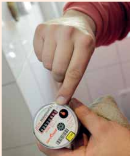
Beim Wasserverbrauch können Sie Einfluss auf Ihre Betriebskosten nehmen

Derzeit werden die Betriebskostenabrechnungen für 2008 verschickt. SAGA GWG Betriebskostenexperte Lutz Mertin beantwortet für Sie die meistgestellten Fragen zu diesem Thema.