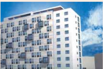
Zum 1. Dezember sind die neuen Wohnungen bezugsfertig

Ein attraktives Wohnhaus entsteht zurzeit in der Schottmüllerstraße 1 in Eppendorf. In dem ehemaligen Schwesternwohnheim der Uni-Klinik bietet SAGA GWG 62 Wohnungen von 49 bis 95 Quadratmetern an – die bei-