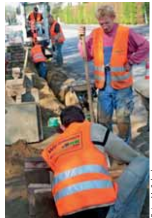
Graben für die neue, schnelle Datenautobahn

Auf Hochtouren haben deshalb 32 Tiefbaukolonnen im letzten Jahr gegraben und Kabel verlegt. Bis Mitte September gab es Erdarbeiten auf einer Strecke von fast 360 Kilometern, die damit bis auf Einzelfälle abgeschlossen sind. Unter öffentlichen Gehwegen erstreckt sich jetzt das neue Glasfasernetz. Durch die Fortschritte bei der Verlegung kam es jedoch an einigen Stellen zu Problemen. So zogen sich manche Erdarbeiten wochenlang hin, aufgerissene Gehwege wurden nicht unmittelbar in den Ursprungszustand zurückversetzt.