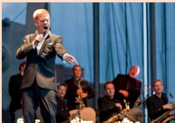
Tom Gaebel ist Deutschlands neuer Sinatra