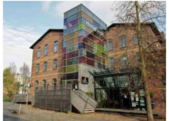
Die Honigfabrik ist ein beliebtes Kulturzentrum in Wilhelmsburg

Do., 10.12. um 10 und 12 Uhr Fr., 11.12. um 10 Uhr So., 13.12. um 16 Uhr Mo., 14.12. um 10 und 12 Uhr Kartenreservierung: Telefon 42 10 39 -20 (-17 Fax)