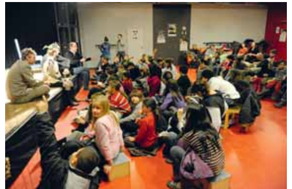
Gemeinsam mit den Kindern wird das Stück erarbeitet