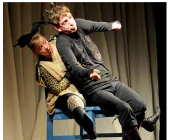
Der blaue Stuhl wird zum Polizeiauto